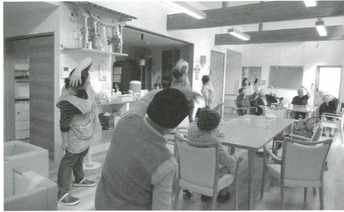
木の香りも気持ちのいい「ぱんたれい」では午後の体操