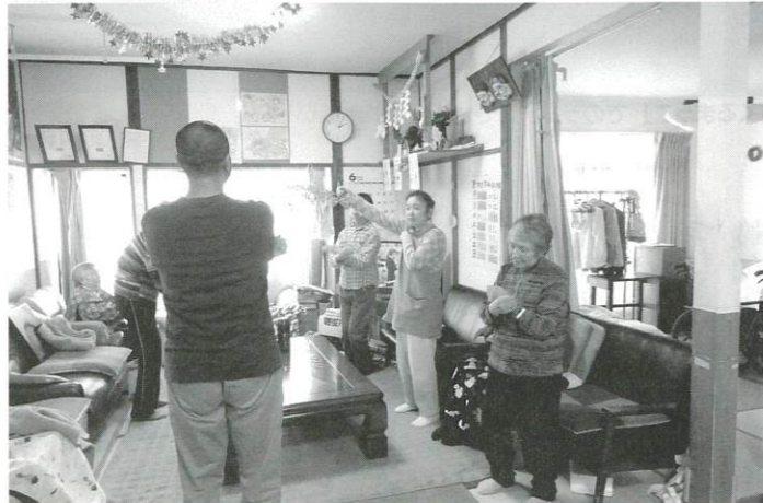
里・つむぎでの体操。障害の人も高齢者もまるごとの日常