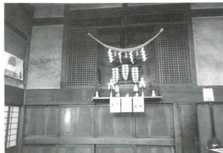
間もなく地域食堂として出発する「古民家ダイなつかしの家」には立派な神棚がある