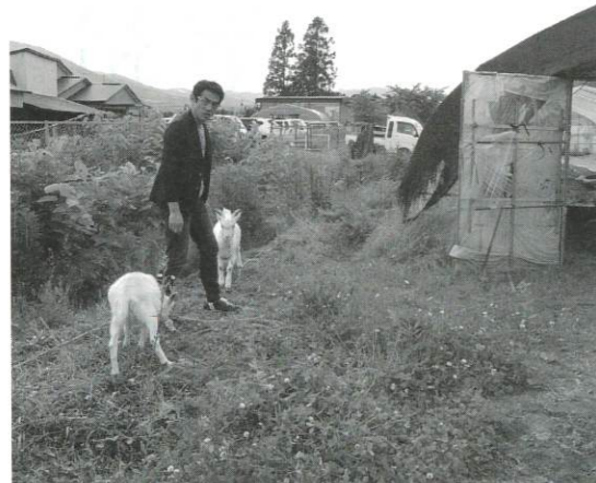
ネコもヤギも「里・つむぎ」のメンバー